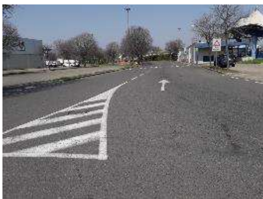
Strada Uffici lato Ovest (Vista da Rotonda)