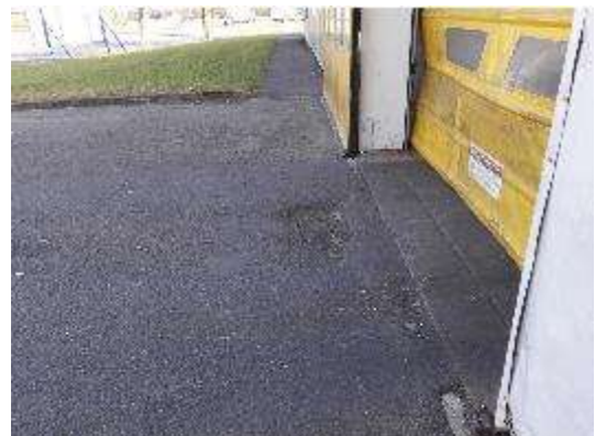
Accesso ad Edificio 06Est – Dettaglio ingresso