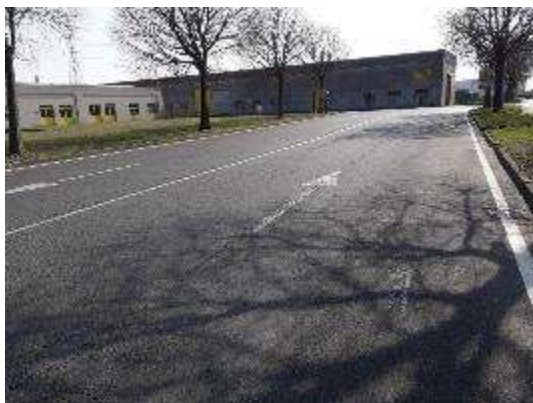
Collegamento da Rotonda a Strada Magazzini (Vista dalla Rotonda)

Si riportano di seguito alcune immagini che rappresentano l'area ed il relativo degrado.