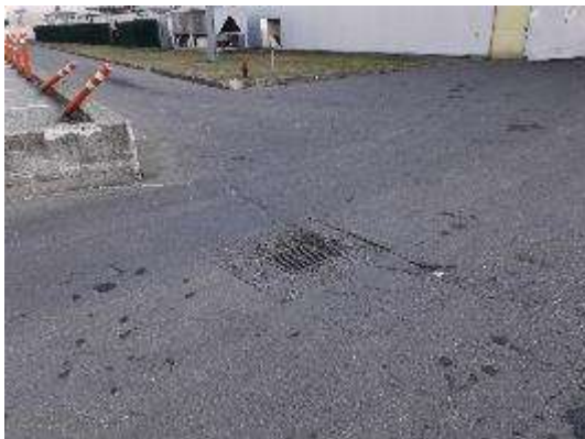
Accesso carraio ad Edificio 06Ovest lato Ovest (Dettaglio tombino)