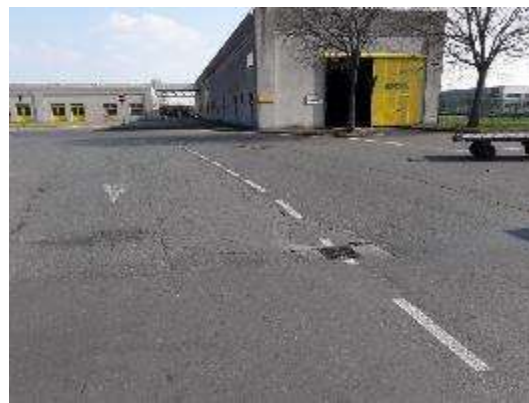
Collegamento da Strada Magazzini alla rotonda (Vista da Strada Magazzini pressi Ed. 06Est)