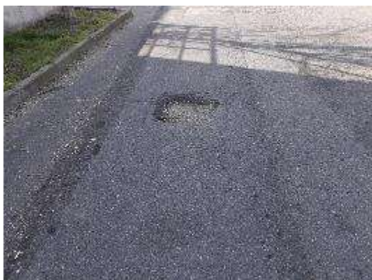
Strada Magazzini – Dettaglio tombino