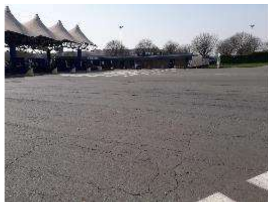
Manto stradale esterno varchi