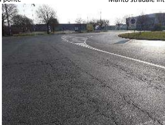
Manto stradale interno varchi in prossimità rotonda