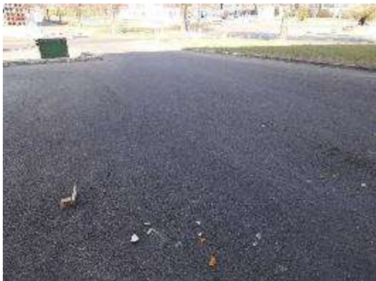
Accesso ad Edificio 06Est