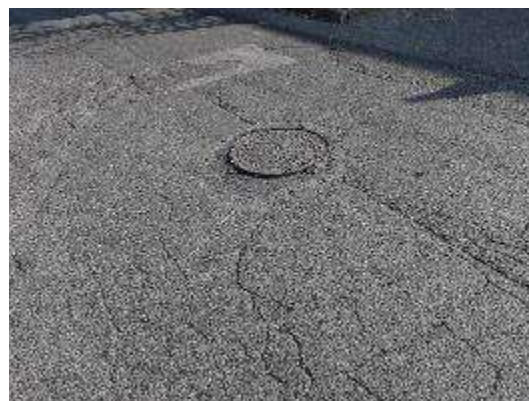
Strada Magazzini – Dettaglio tombino