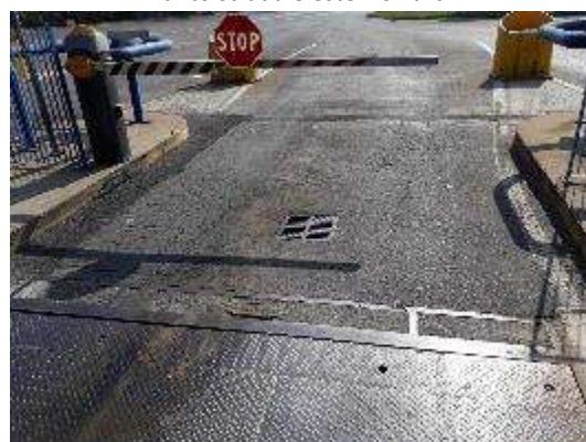
Varco con pesa ponte