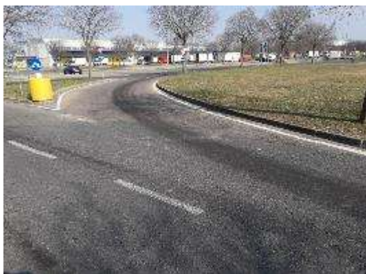
Accesso da Strada Ovest per Strada Ortofrutta Nord (Lato Sud)

Si riportano di seguito alcune immagini che rappresentano l'area ed il relativo degrado.