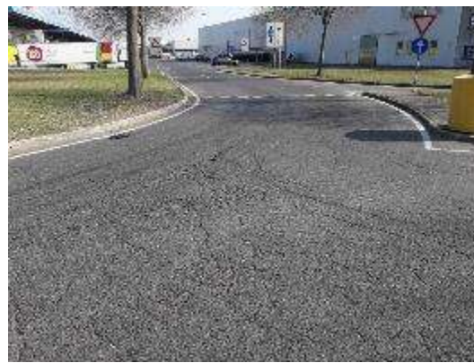
Accesso da Strada Ovest per Strada Ortofrutta Sud (Lato Nord)