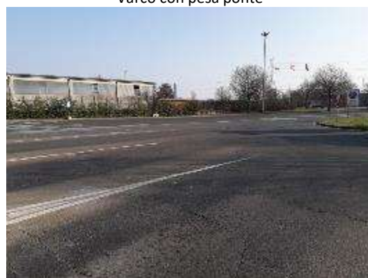
Manto stradale interno varchi in prossimità varchi