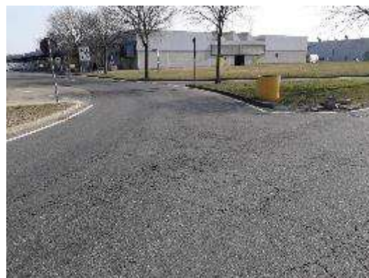
Accesso da Strada Ovest per Strada Ortofrutta Nord (Lato Nord)