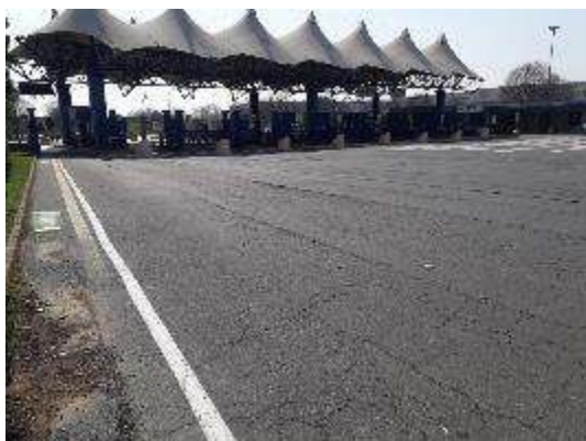
Varchi lato esterno