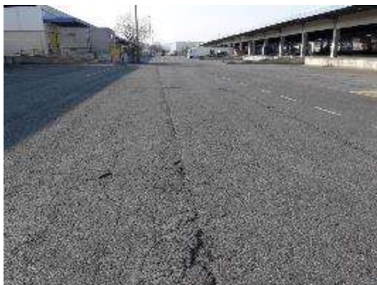
Strada Magazzini – tratto tra TGV ed Edificio 07

Si riportano di seguito alcune immagini che rappresentano l'area ed il relativo degrado.