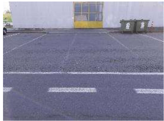
Accesso carraio ad Edificio 06Ovest lato Est