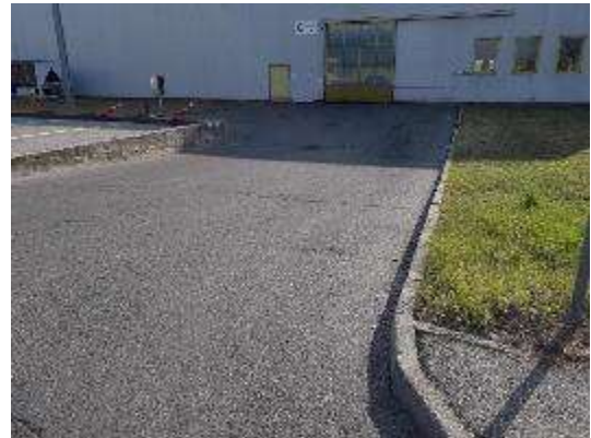
Accesso carraio ad Edificio 06Ovest lato Ovest