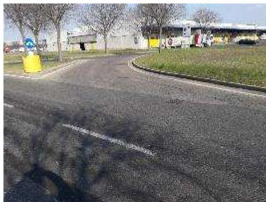
Accesso da Strada Ovest per Strada Ortofrutta Sud (Lato Sud)

Si riportano di seguito alcune immagini che rappresentano l'area ed il relativo degrado.