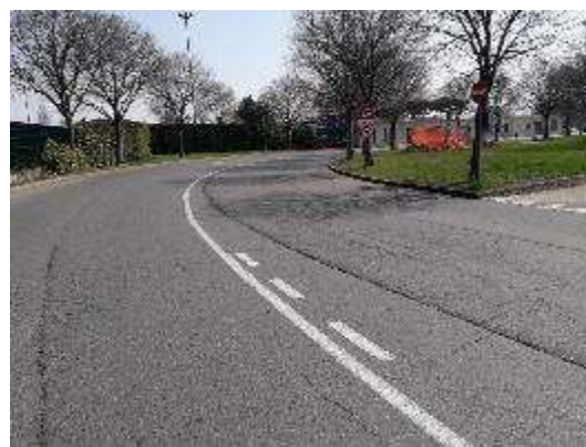
Strada Uffici lato Ovest (Vista da Nord)