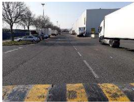
Strada Magazzini – tratto Edificio 06Ovest e Area ecologica