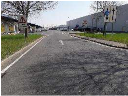
Accesso da Strada Ovest per Strada Ortofrutta Sud (Collegamento a manto rivisto)