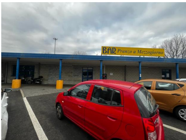
Vista esterna – lato Nord-Est