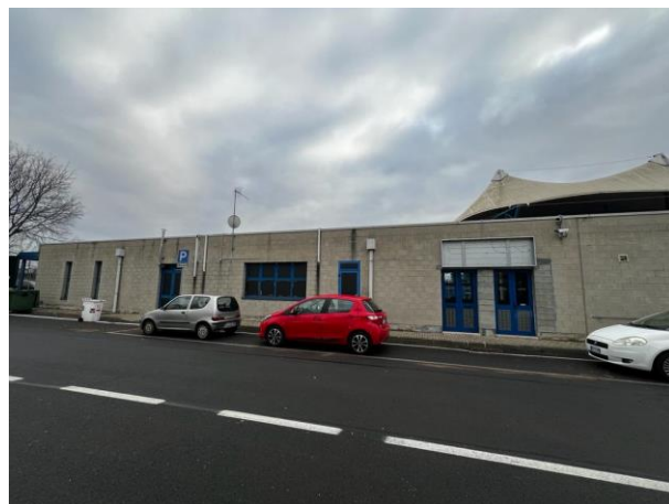
Vista esterna – lato Nord - Ovest